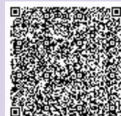
実習生帰国時の MiRAiブログです