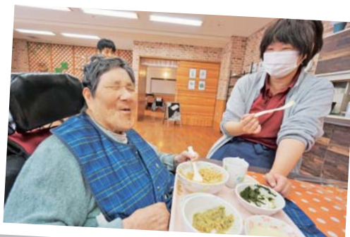
「みなみかぜに来るのが楽しみになった!」彩りのある空間だけでなく、何よりカフェ店員になりきったサービスが営みに楽しさを添えている。