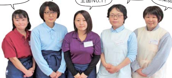
こっくさん さつきちゃん みなみちゃん みどりちゃん なつちゃん

レストランのためなら何でもするよ! 元気で誰にも負けない! 接客全国No.1! 手洗いのスペシャリスト! 心優しい服薬師さん!