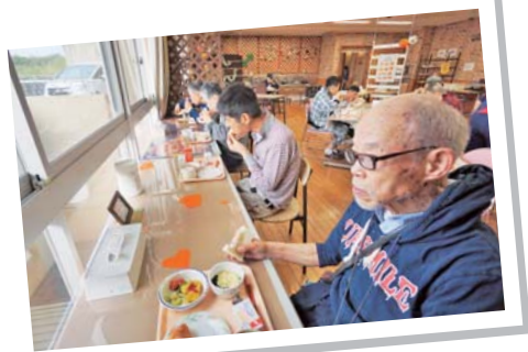
大きな窓に面したカウンター。行きかう人や空を眺めながら、ゆっくり食事をする事ができる。

そこで、利用者ファーストでホスピタリティを実践しようと考えたのが、「レストランのワクワク感」「カフェのくつろぎ」を徹底して取り入れた食堂へのリニューアル。職員自らも、カフェ店員やコックになったつもりで接客すれば、「お客様へ提供するサービス」がわかりやすく実践できるに違いない。遊び心で取り組めば、私たちも楽しいはず!と、職員発案の企画が実施されることになりました。