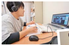
グループワークで気付きを得る

未来志向の組織づくりに活かす、将来の マネージャーを育成する研修「 ステージ プラス2020 」は、教育機関に研修プロ グラムの実施を委託し、東京と名張育成会 をオンラインで結んで月に1日、朝10時~ 17時まで集中して行っています。