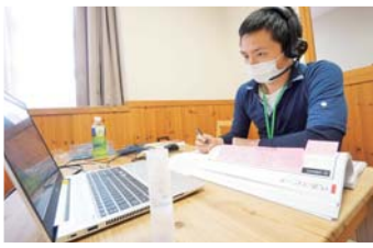
教育機関による講義で 思考力を高める

今年の1月から実施した、キャリアアップ研修「 ステージプラス2020 」は、コロナ渦による 中断後の6月からオンラインで再開し、ICT化によるインフラ活用の試金石として、 研修プログラムの先駆けとなっています。