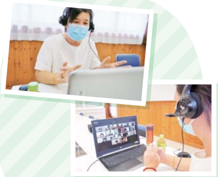
ショートスピーチで リーダーシップに触れる

課題ごとに、一日に何度も繰り返して行うグル ープワーク。管理職が4~5人グループのファシリ テーターとなり、意見交換をしながら短時間で自 分の考えをまとめることで、それぞれに気付きを 得ていきます。