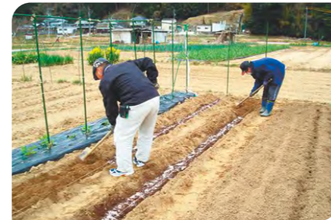
レインボークラブ(就労継続支援事業B型)