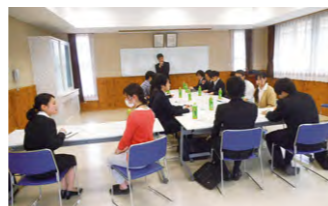
説明会での座談会の様子です。センパイと仕事の内容や、仕事でのやりがいについて、ざっくばらんに話します。

※名張育成会リクルートHPからでもエントリー可能です。 ※上記日時にご都合のつかない方は、お気軽にご相談ください。随時対応させていただきます。 ※近鉄大阪線「桔梗が丘駅」まで送迎いたします!ご希望の方はお申し出ください。 (お問合せ、お申し込み先) TEL:0595-65-0271(担当:人事課 森下) メール:jinji@n-ikuseien.jp リクルートサイト:http://www.n-ikuseien-recruit.jp/