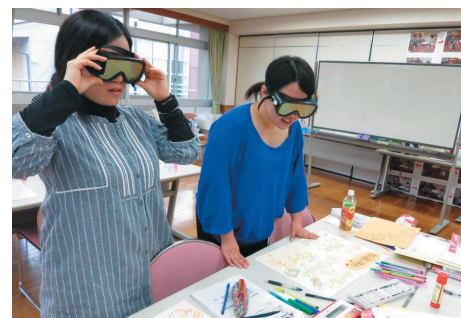
目の弱くなった人がどのように見えているかを疑似体験する場面も。

今後はこの学びを他の職員とも分かち合えるように、さらに学びを深めたいという。現場でもさらに職員がブラッシュアップされ、より質の高い支援の連鎖が広がっていくに違いない。