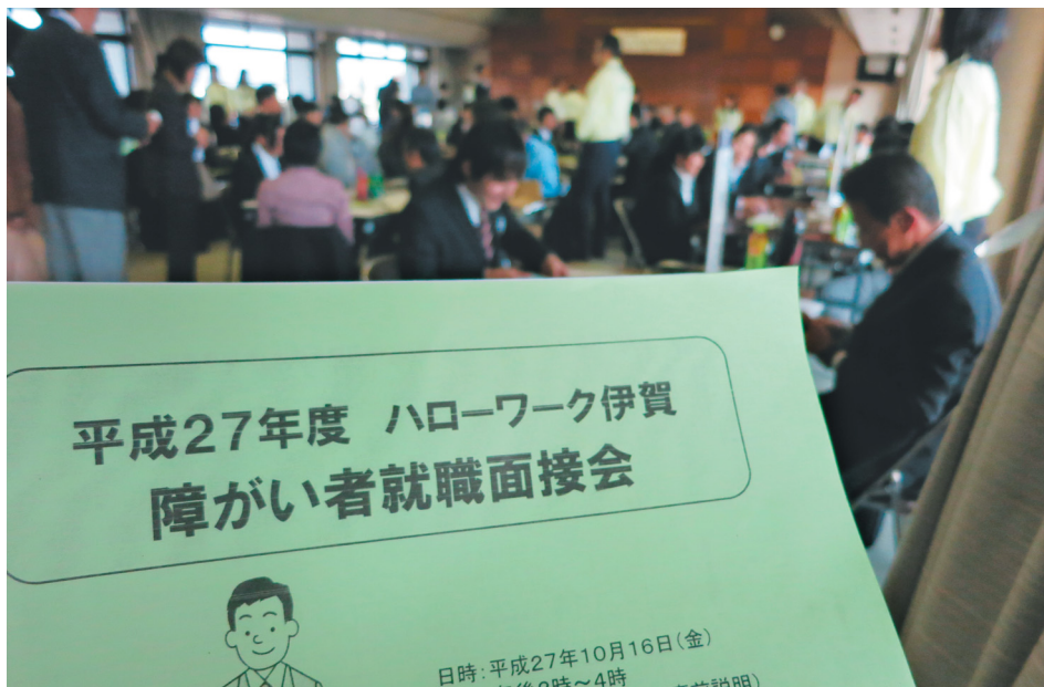
面接会場となった三重県伊賀庁舎大会議室には、「働きたい」「受入れたい」という双方の願いで溢れていました。

企業側の採用意識も年々高くなり、22社の募集に対してキャンセル待ちが出たほどです。そんな中、本年は新たに8社が参加し、100名を越える就職希望者が集いました。