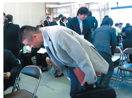
よろしくお願いします!職員も、挨拶に気持ちが入ります。

接に臨めるよう履歴書のアドバイスや面接練習を繰り返したり、当日も面接官に上手く伝わらなかったと思われるところや、面接官の求めに応じて平素の様子や得意分野などを紹介したり、少しでも利用者さんの人となりや伝わるよう面接に寄り添います。また採用が決まれば、円滑に就労がスタートできるようご本人の特性(性格・得意不得意・体力など)や、その方に合った指示命令の方法、勤務時間、作業内容などといった合理的配慮に関し、企業側と綿密に打ち合わせます。利用者さんとともに働く喜びを見つける、就労支援の大切な役割です。