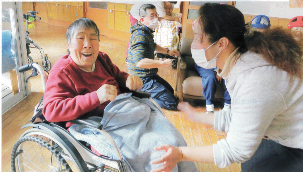
午前中は体操などで体をほぐし、昼からはコーラスで声を出す。