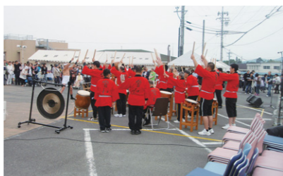
育成園まつり(5月18日開催)