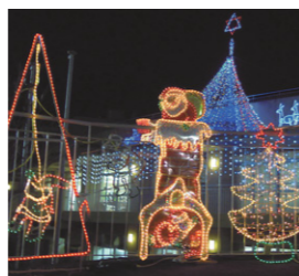
X'masイルミネーション(毎年12月開催)