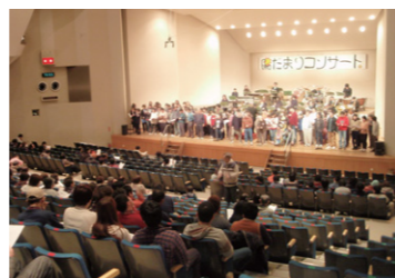
陽だまりコンサート(毎年3月開催)