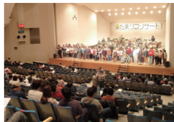
陽だまりコンサート(毎年3月開催)