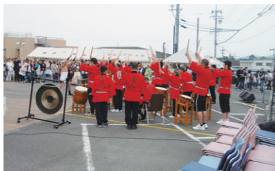
育成園まつり(5月18日開催)