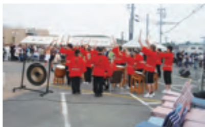
育成園まつり(毎年5月開催)