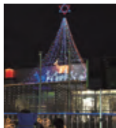
X'masイルミネーション (12月7日開催)