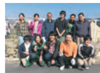
実行委員会の皆さんです