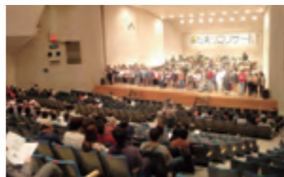
陽だまりコンサート(翌3月2日開催)