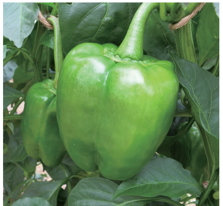
出荷間近のジャンボピーマン。そのとなりで雑草をむしったり、新しい種を撒いたり、こだわりの作業は続きます。

さて、こだわり野菜の出荷を始めて一年以上が経った今、誰もが耕す土を愛おしく思い、流した汗に心地よさを覚えています。何より、