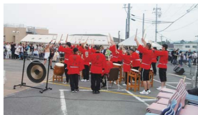
育成園まつり(5月19日開催)