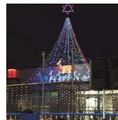
X'masイルミネーション(12月7日開催)