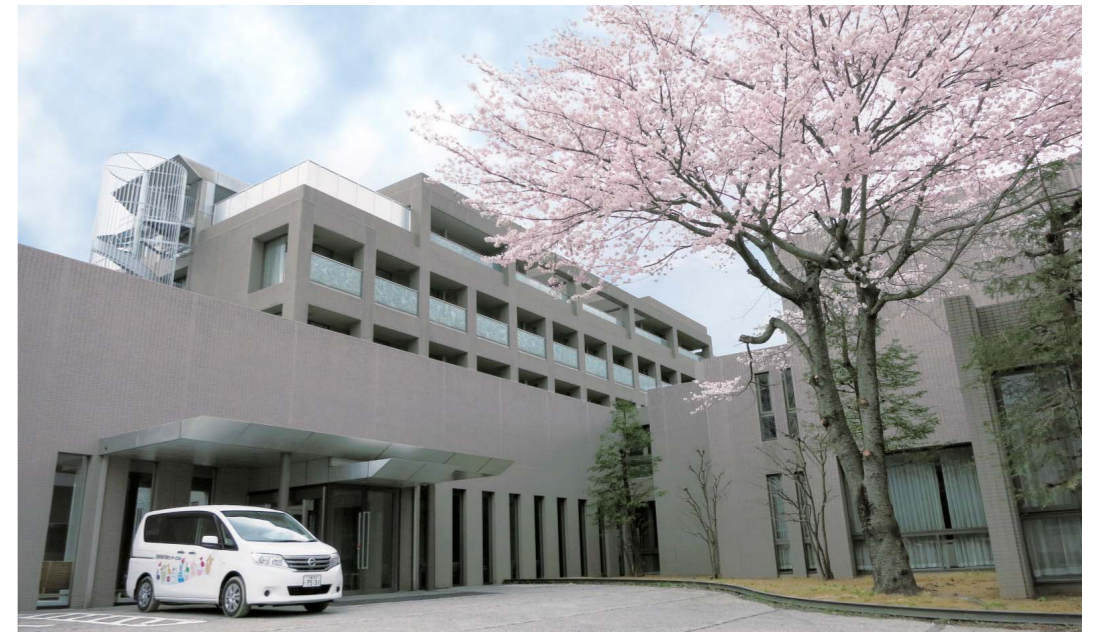
製薬会社の元研修施設を改修した、広く便利な施設です。

訓練室に設けられた「見守り室」。子どもたち訓練の様子を、そっと見守ることが出来ます♪とっても安心ですね！