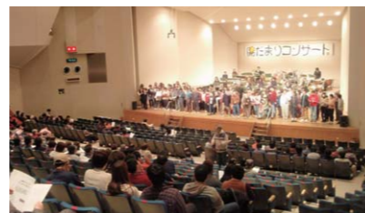
陽だまりコンサート(翌3月2日開催)

名張育成園では、みなさんにほんの少しからでも親しみを持っていただけるよう、またお役にたてるようさまざまな活動をしています。