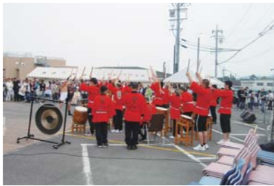
育成園まつり(5月19日開催)