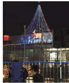
X'masイルミネーション(12月7日開催)