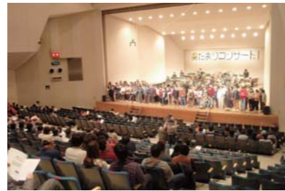
陽だまりコンサート(翌3月2日開催)