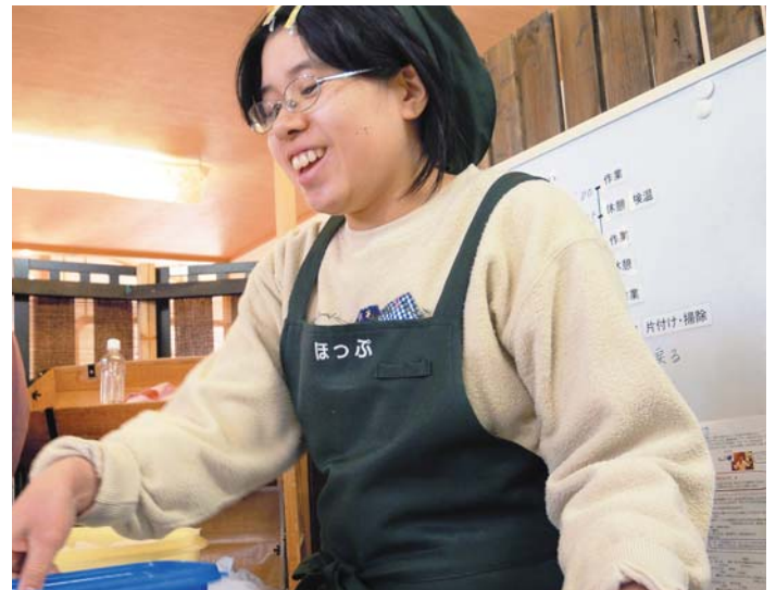
〈ほっぶ〉では、オリジナルクッキーも人気メニューのひとつ。 接客の優しさは、クッキー作りにも活かされています。

でも、なんといっても元気の源 は、お客様の笑顔。お客様が〈ほっ ぶ〉を愉しんでくれている姿に接す ると、本当にうれしくなって自信に 繋がります。大会当日は、そんなお 客様の笑顔が見られるよう、「急が ず、丁寧に」を心がけ、身だしなみ はもちろん、ハキハキと受け答えで