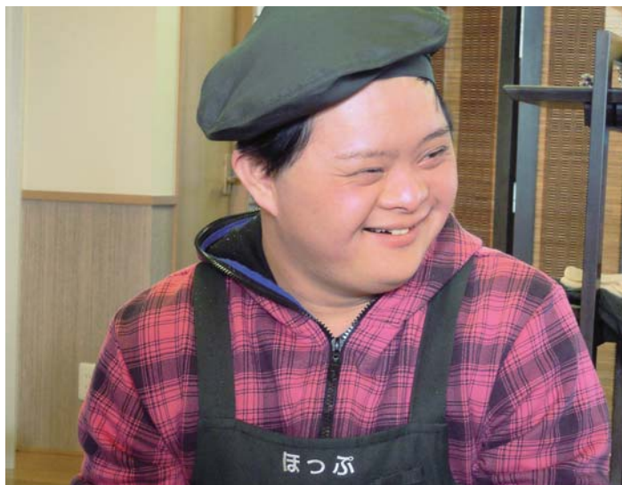
笑顔で、ハキハキと答える姿がとても印象的! メニューにお子さまランチを加え、地域の色々な方に来店いただくのが夢だとか。

CAFÉ & GALLERY ほっぶ (住所)名張市新田字出山1225-1 (連絡先)TEL 0595-66-5513 (営業時間)10:00~17:00 定休日(土・日・祝) ただし毎月、最終土曜は営業!!