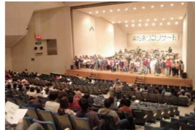
陽だまりコンサート(毎年3月開催)