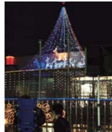
X'masイルミネーション (毎年12月開催)