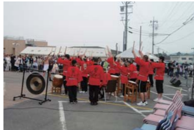
育成園まつり(毎年5月開催)