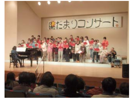
市民の方と結成した「陽だまりコーラス」