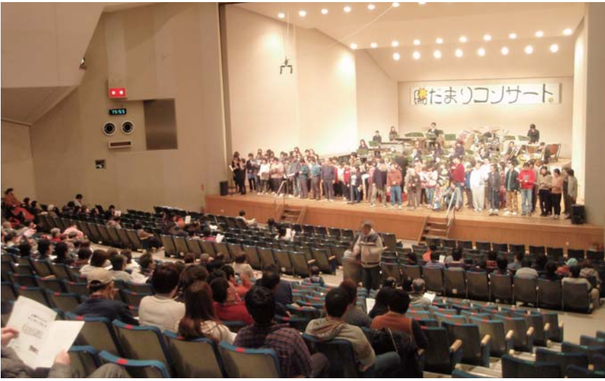
出演者のみなさんと、客席が一体となって歌った「つばさをください」。上野ウインドアンサンブルによる伴奏で、会場いっぱいに歌声が響いた感動のフィナーレです。